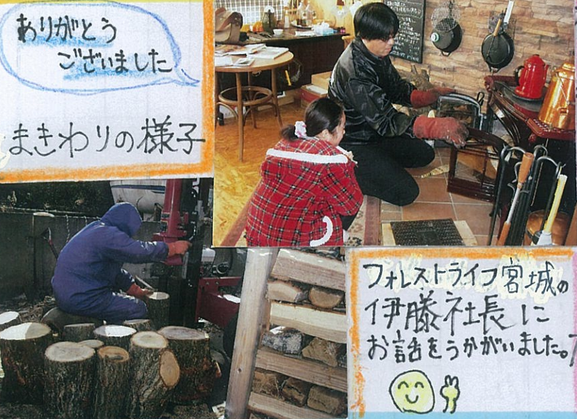
ありがとうございます まきわりの様子

かんきょうに優しいだんぼう器具として注目されてるまきストーブのせんもん店。木材に行ってください。