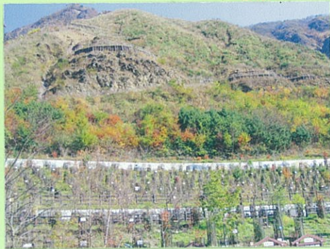
足尾にはきれいな川と山がもどってきていました。

私たちが自転車で走った渡良瀬川の 上流には、足尾という町があります。 足尾には昔、銅をとり出す工場があ りました。公害で山がはげ山になっ てしまいました。今ではその山に植 林をしています。この活動によって いまでは、足尾の山々に緑がいっぱ いもどってきていました。