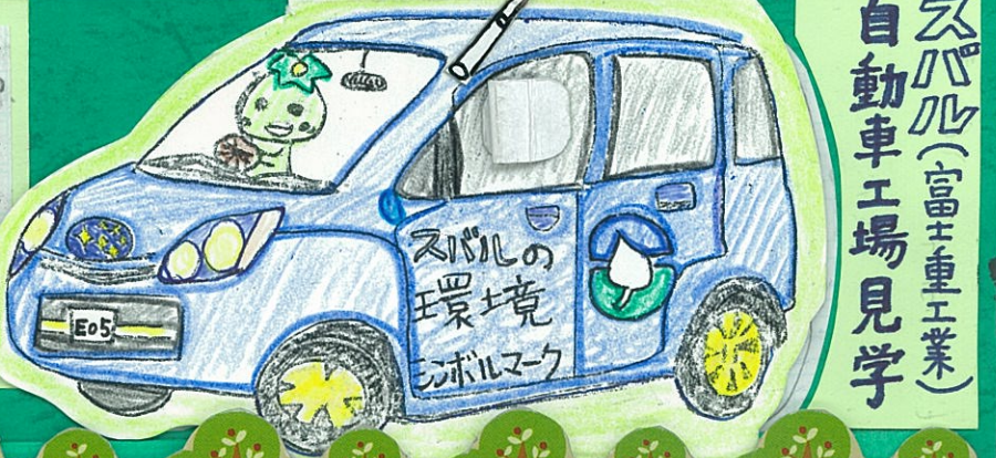
スバル(富士重工業) 自動車工場見学

木を切ることがエコ!? 山を元気にするた めには、みなながた く、木を切ったり、 木を植えることが 必要です。木を切 ることも大切だと 知りました。