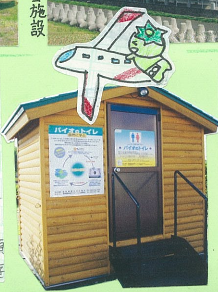
30kmのスタートは大学のエコ施設