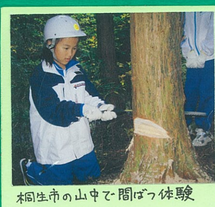
桐生市の山中で間伐体験

川遊びは、環境を 守るために、自分 の力で、自然を守 り、川遊びで感 じたこと。