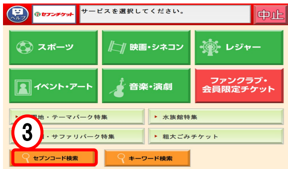
③「セブンコード検索」を押す