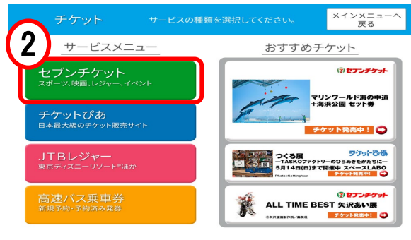
②「セブンチケット」を押す