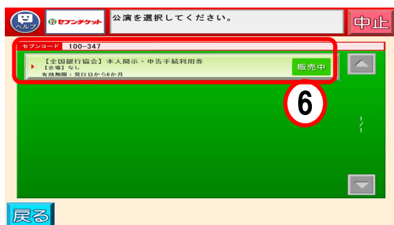
⑥「【全国銀行協会】本人開示・申告手続利用券」を押す