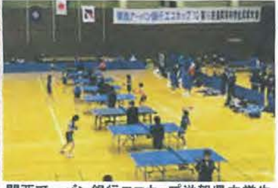
関西アーバン銀行エコカップ滋賀県中学生大会

温暖化防止啓発活動や、 参加者からペットボトルを 集めてリサイクルする活動を行 うなど、環境啓発型大会 としていきます