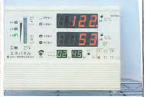
デマンド監視装置

地域社会の持続的発展 のために環境保全活 動に積極的かつ継続的 に取り組んでいます。 関西電力管内における電力 受給バランス逼迫に備え、デマ ンド監視装置を導入し、 夏季・冬季における節電 対策を強化しました。