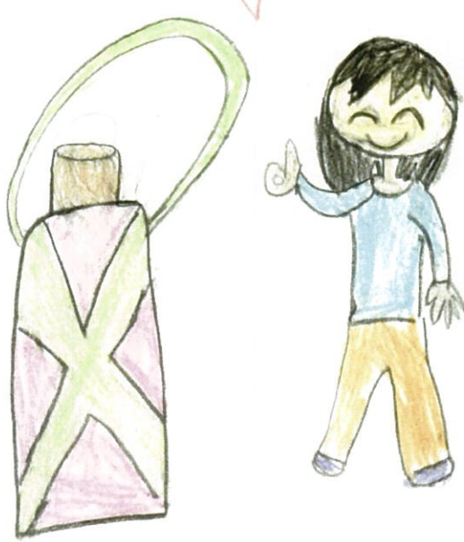
マイボトルマイ水とう

★エネルギーをかわなくエコ ★ゴミをへらせて、エコ。 ★二酸化炭素をへらせて、エコ。