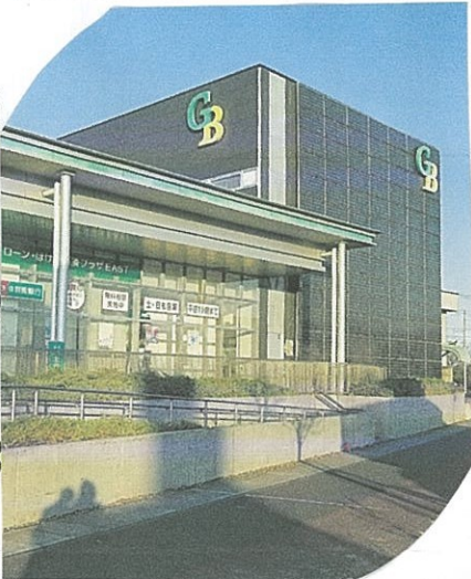
「かべが太陽光 一前橋北支店」

今、CO 2 を出さない再生可能エネルギーが注目されてきました。群馬銀行前橋北支店に取材に行