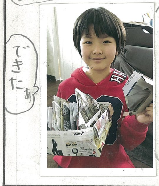
写真をはったり、イラストをかこう