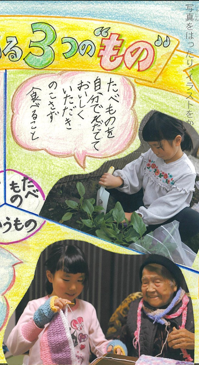
写真ははったりイラストをか

ひつようなものは 自分でつくったり リサイクルして 作りなおしたり して大切に つかうこと