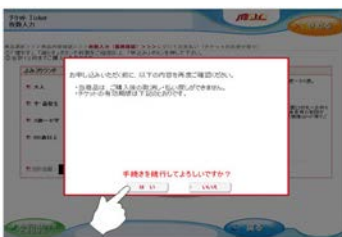
⑦画面の案内を確認し、 同意される場合は「はい」をタッチ。