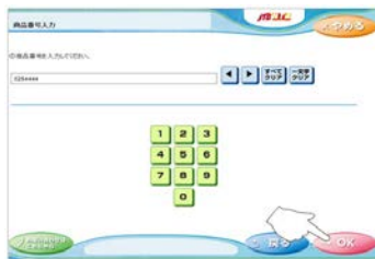
④JTB商品番号(0254444)を 入力し、「OK」をタッチ。