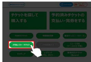
②「JTブレジャーチケット」をタッチ。