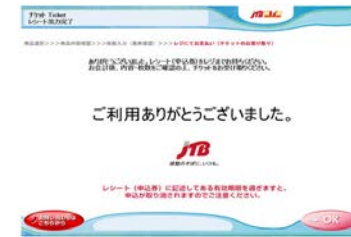
申込券が印刷されます。 申込券を30分以内にレジにお持ち になり、代金をお支払ください。