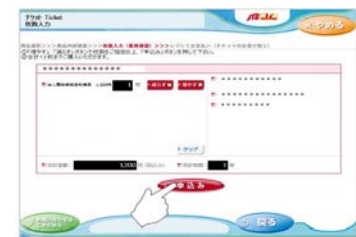
⑥内容・金額を確認し、「申込み」をタッチ。 ※同一の方が旧氏名を含む2つ以上のお名前による開示を同時に受けられる場合も、おひとり分です。