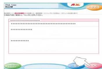
⑤商品内容を確認し、間違いが なければ、「OK」をタッチ。