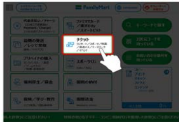
①ファミリーマートのマルチコピー機 トップ画面から「チケット」をタッチ。

ファミリーマートのマルチコピー機で「チケット」⇒「JTブレジャーチケット」⇒「商品番号から検索」 ⇒ JTB商品番号(0254444)を入力し、購入の申込を行ってください。