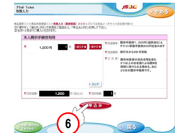
⑥内容・金額を確認の上「申込み」をタッチ。 ※同一の方が旧氏名等を含む2つ以上のお名前による開示を同時に受けられる場合も、おひとり分の本人開示手数料です。