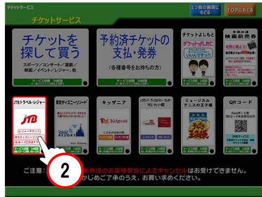
②「JTBトラベル・レジャー」をタッチ。