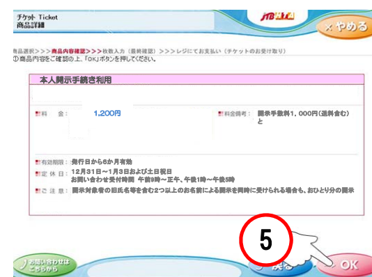
⑤商品内容を確認し、間違いがなければ「OK」をタッチ。