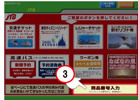
③「商品番号入力」をタッチ。