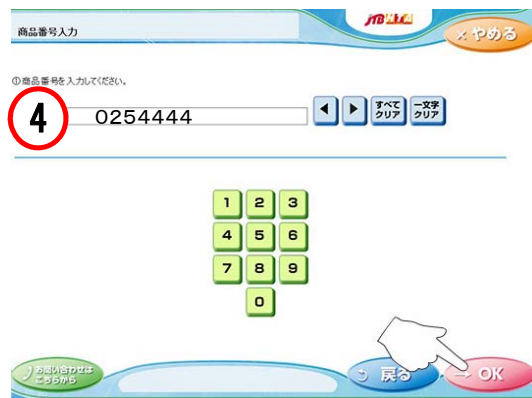
④JTB商品番号(0254444)を入力し、「OK」をタッチ。