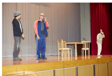
「オレオレ詐欺」寸劇の様子