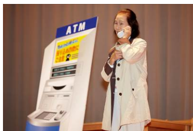
「還付金等詐欺」寸劇の様子