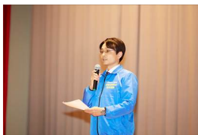
挨拶と全国銀行協会の活動紹介