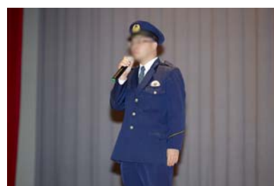
千厩警察署担当官による解説の様子