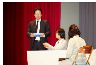
「オレオレ詐欺」寸劇の様子