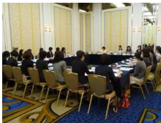
「WE-Net 福岡」第1回会合（2013年10月）

開催会場は、会員企業・団体の会議室などを利用し、会員企業の幹部や社員にも活動を広く周知している。