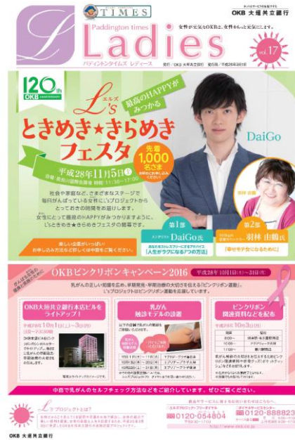
「パディントン TIMES Ladies」