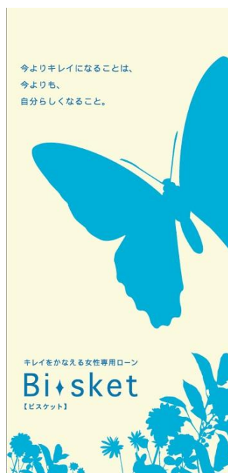
「Bi - sket」