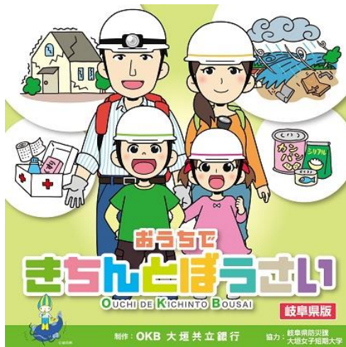
防災冊子「おうちできちんとぼうさい」