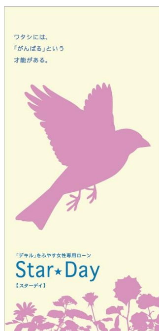
「Star - Day」